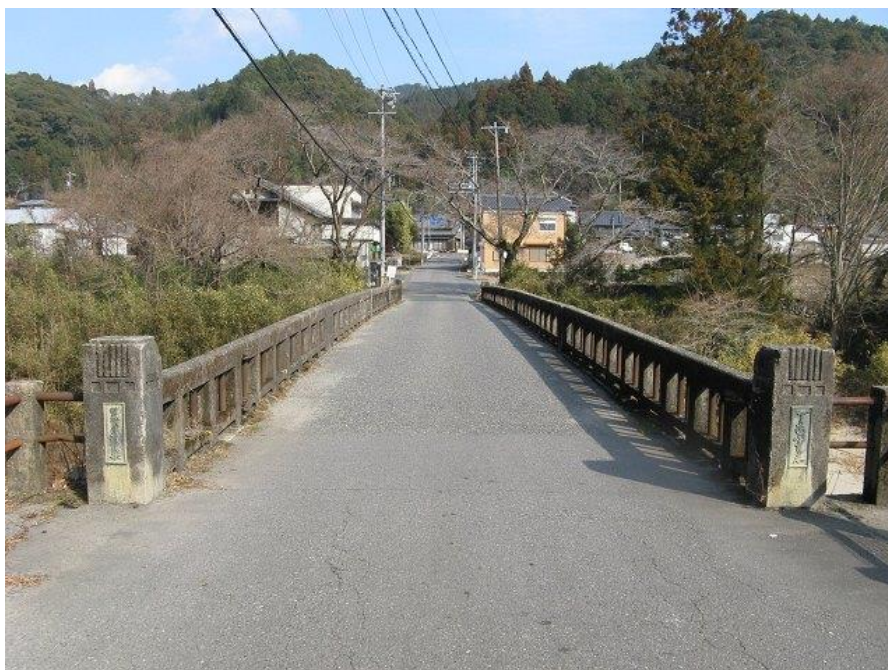
出合橋(市道只持出合線)

道路交通の安全性を確保する上で、これまでの事後保全的な対応から計画的かつ予防的な対応に転換し、橋梁の長寿命化によるコスト縮減を図るため、長寿命化修繕計画に沿って橋梁の修繕を行います。