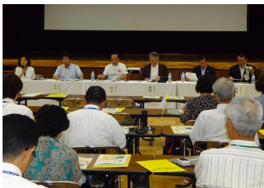
平成26年7月に飯田市で開催された 第5回中部環境先進5市サミット

持続可能な社会の構築には、環境・経済・社会的構成がバランス良く成り立っていくことが不可欠です。そのために再生可能エネルギー導入によるエネルギー・セキュリティの確保に向けた施策を展開していきます。