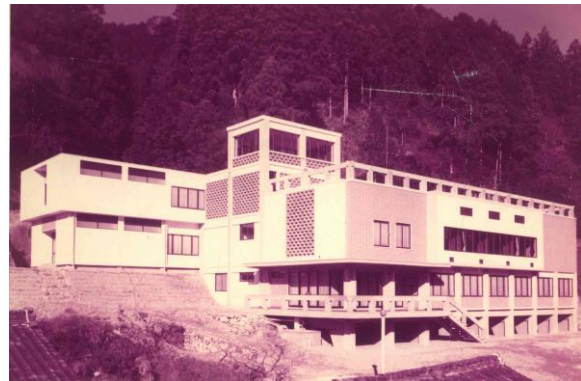
開館当時の「鳳来寺山自然科学博物館」