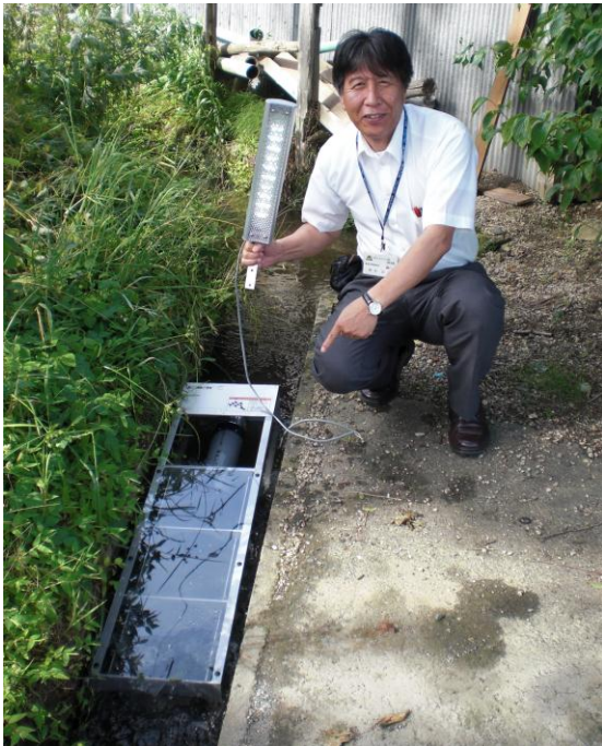
水力を利用した発電機でLEDライトを点灯