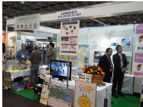
中部環境先進5市でメッセナゴヤ2012へ出展

また、環境首都コンテストで交流が生まれた多治見市、安城市、掛川市、飯田市、などと更なるステップアップを目指した共同プロジェクトなどについても研究していきます。