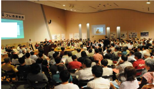
[市民まちづくり集会のイメージ]