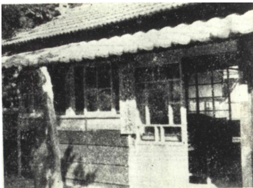
博物館の前身「田口鉄道自然科学博物館」

担当課 教育部 文化課博物館 電話 0536-35-1001 メールアドレス hri-hakubutukan1@city.shinshiro.lg.jp