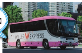
新たに夜行バスが 運行開始【東京行き】 1日1便運行中