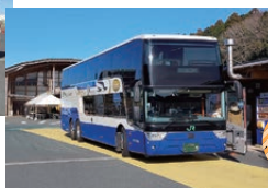
昼間の時間帯に 1日6便運行中