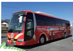
名古屋行き 1日3便運行中