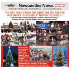
[Newcastles of the World Newsletter]