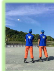
防災ドローン航空隊