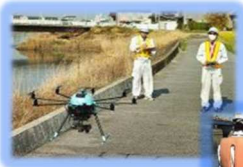
ドローン搭載型 レーザーによる 地形計測