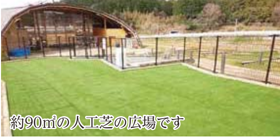
約90㎡の人工芝の広場です

その他 このドッグランは愛知県の「元気な 愛知の市町村づくり補助金(チャレン ジ枠)」を活用して整備しました。