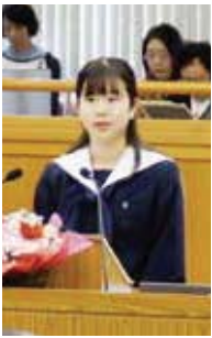
▲過去の女性議会の様子