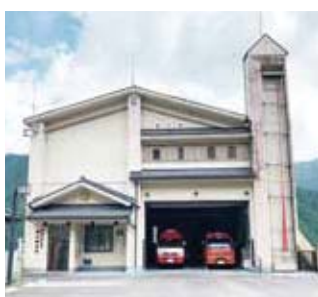
▲閉所する富山駐在所

その後、地域理解が得られたことを受け、9月30日(木)をもって「新城市消防署富山駐在所」を閉所としました。