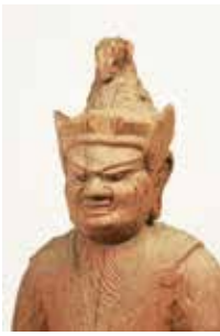
▲長篠・富永神社の牛頭天王像