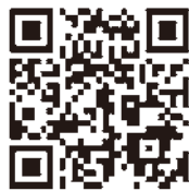
▲こちらからご覧ください。