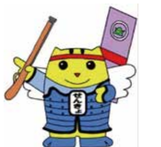
新城市明るい選挙 推進イメージキャラクター 「しんしろ戦国めいすいくん」