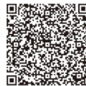
▲アンケートフォーム