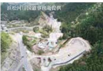
▲新城市側から東栄ICを望む