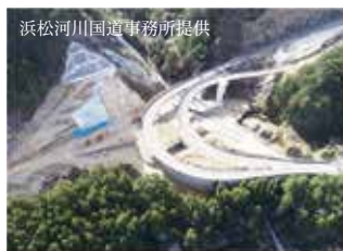
▲工事が進む鳳来峡IC