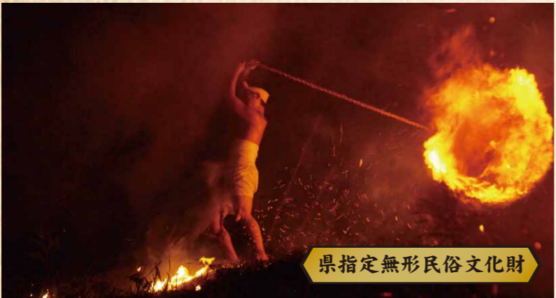
県指定無形民俗文化財

万灯山で縄のついた麦わらで作った万灯に点火して、「マンド、マンド、ヨーイ、ヨイ」の掛け声とともに、頭上で大きく振り回します。 精霊送り・悪霊祓い・若者の通過儀礼として行われます。また、長篠の戦いの戦死者を慰霊する意味合いも込められているともいわれます。 ◆8月15日(土) 午後7時30分 ◆会場：乗本区・万灯山