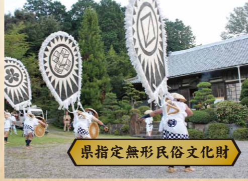
県指定無形民俗文化財

室町時代に放下僧と呼ばれた人たちが歌い舞い、曲芸や手品を演じながら各地に広め伝えた「ほうか踊り」が変化し土着した精霊供養です。新仏(初盆)のある家や寺社などを訪問して踊り歩く「新仏供養」と、大団扇を背負って踊る「念仏踊り」が混ざっています。 大海区 ◆8月14日(金)・15日(土) 午後5時 ◆会場：泉昌寺 一色区 ◆8月14日(金) 午後6時30分 ◆会場：洞泉寺 名号区 ◆8月14日(金) 午後8時 ◆会場：石雲寺 布里区 ◆8月15日(土) 午後6時 ◆会場：御堂橋→普賢院 塩瀬区 ◆8月15日(土) 午後7時 ◆会場：高月寺