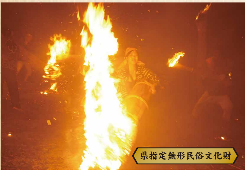
県指定無形民俗文化財

下駄履きに片手に太鼓を持ち、皮と縁を交互に打ち鳴らす演技は力強く感動的です。精霊供養として行われます。 身平橋地区(四谷区) ◆8月13日(木) 午後7時 ◆会場：四谷身平橋「海源寺」