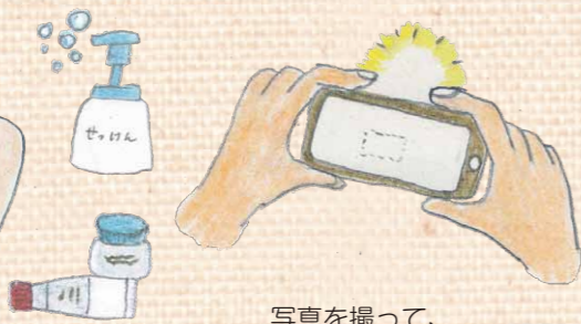
写真を撮って、経過を観察しました