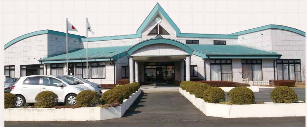
いきいきライフの館

これからの公共施設のあり方について考える第一歩として、市が保有する施設の全体像を「見える化」した「新城市公共施設白書」を発行しました。 この連載で、新城市公共施設白書の内容を紹介しながら、公共施設の現状と今後の課題についてお知らせしていきます。