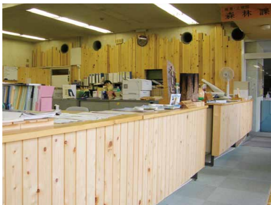
新城産材を生かしたカウンター（森林課）

◆木材を生かした庁舎 市役所には、日々多くの市民や事業者の方が訪れます。新庁舎では、多くの方の目に触れる市民スペースや外装などに木材を使用することで、木の良さが身近に感じられ、PRの場となるように整備します。