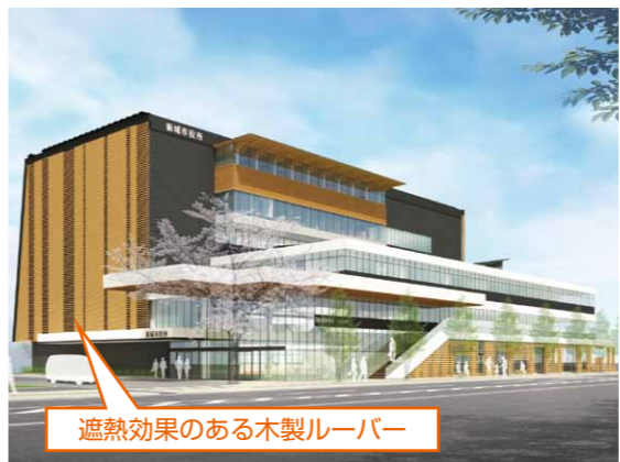
遮熱効果のある木製ルーバー