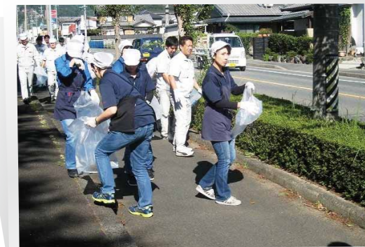
▲回収された「ポイ捨てごみ」や タイヤなど（富岡ふるさと会館にて）