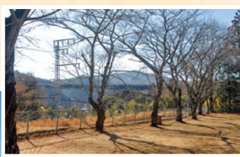
長篠城址と新東名

長篠・設楽原の戦いはいろいろな歴史の流れの中で起こった戦いです。この戦いに至るまでに数十年の積み重ねと人と人の交わりがありました。特に新城はどこにいてもこの戦いにつながっていきます。地形、風景、気候など、新城に住む人でないと分からないことがたくさんあります。古文書のような史料だけでなく、そうしたことも本当の戦いの姿に迫る大切なことです。最新の研究成果を踏まえつつ、私たちが戦いの本当の姿を築いていきましょう。