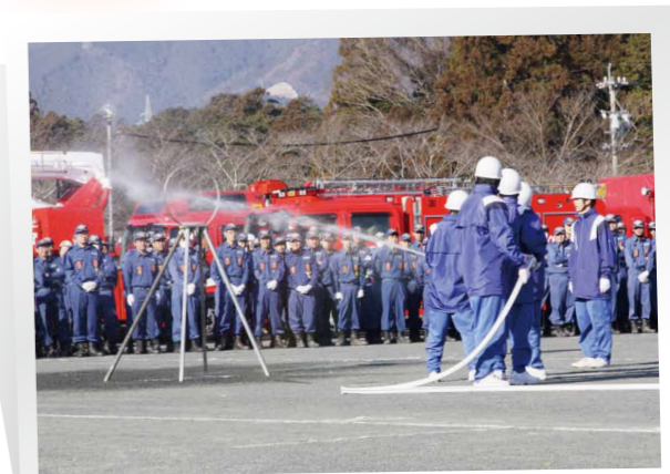
千郷中学校少年消防クラブによる放水訓練