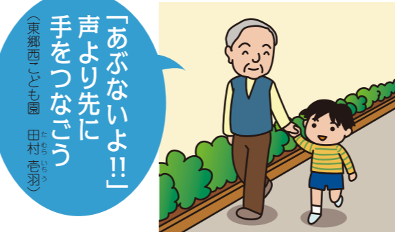
平成25年度 新城市親子交通安全標語 優秀作品

Job placement office SHINSHIRO 22-1160 新城