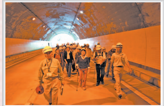
現場ガイドツアー

平成23年度に三遠南信自動車道三遠道路の供用開始が予定されています。皆さんに三遠南信地域の交流を深めていただくため、「三遠道路開通前記念イベント」が開催されました。鳳来東小学校児童のファンファーレで始まり、さまざまな催しものが花を添えました。