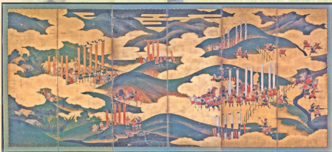
長篠合戦図屏風 (所蔵：名古屋市博物館)

私たちがよく目にする長篠合戦図屏風には、武田軍に相対する織田・徳川連合軍が馬防柵の近くで火縄銃を構えている様子が描かれています。