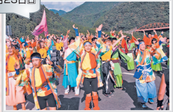
よさこいダンスパフォーマンス