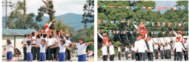
運動会「合戦と農民」