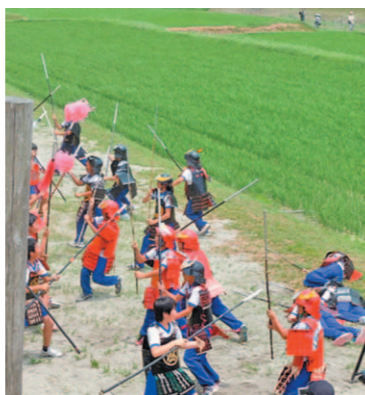
設楽原決戦場まつり

から6年生は陣笠をかぶり、手作りの鎧に身を固めて小学校から馬防柵のある決戦場まつりの会場へと行軍する。そして、東郷西小学校児童と東郷中学校の生徒と合流し、合戦を再現する。