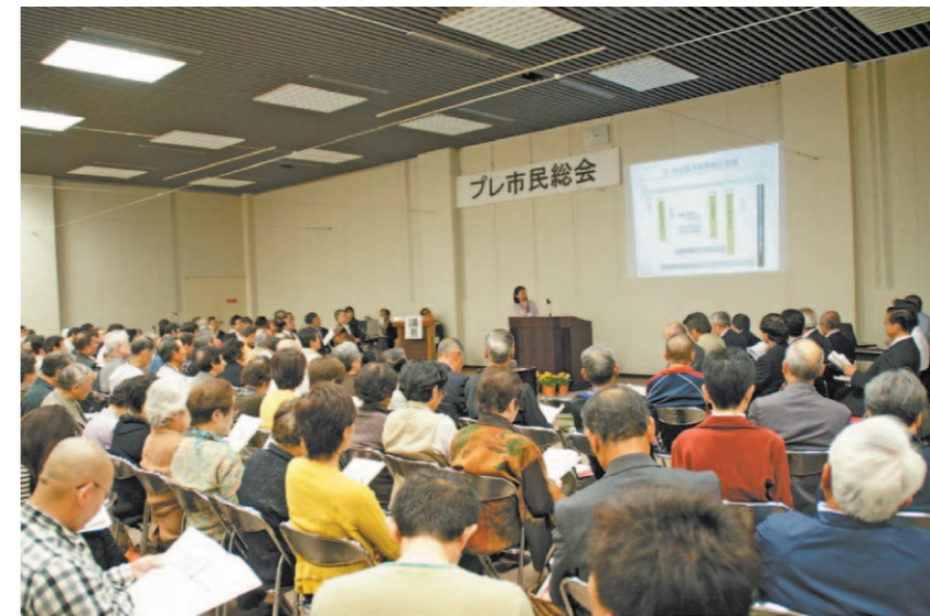
「プレ市民総会」の様子

8月号から、「市民のことばによる新城市自治基本条例（たたき台）」の内容をご紹介しています。今月は、「行政」です。基本的な考え方、役所の組織、市長の責務、職員、財政、市民の意見、市民参加のしくみ、情報公開、元気の出る行政について左のページに掲載しました。皆さんのご意見をお寄せください。