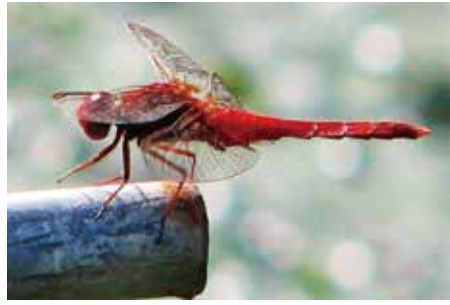
▲ショウジョウトンボ