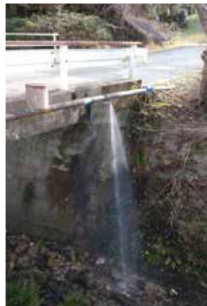
▲本市で発生した漏水

まの状況では、水道管の漏水や施設異常の発生により、長期にわたる断水や水質悪化につながる恐れがあります。