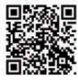
▲詳しくはOSJトレイルレースHP

◆初級者からエキスパートと幅広く参加する32kmコース(26日) ◆エキスパート以上が体力の限界に挑戦する64kmコース(26日) ■キッズ2部門 ◆キッズ1kmコース(25日)(小学1～3年生対象) ◆キッズ3kmコース(25日)(小学4～6年生対象)