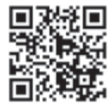
▲愛知県警察採用情報ウェブページ