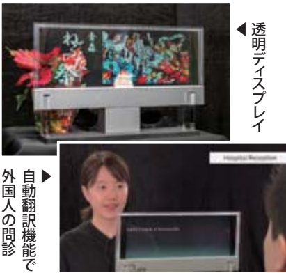
自動翻訳機能で外国人の問診