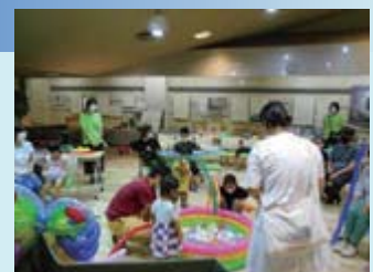
▲昨年度のバルーンアートの様子