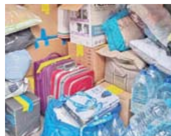
ウクライナへ届ける物資とトラックに運び入れた時