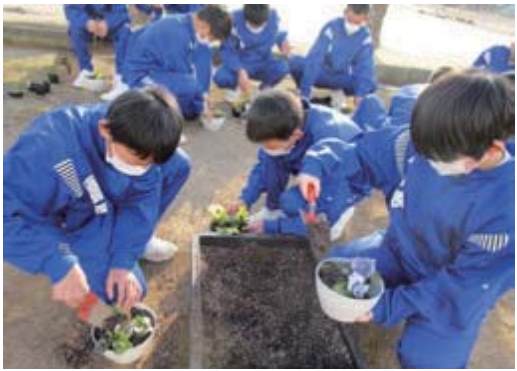
▲あいち森と緑づくり都市緑化推進事業