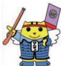
▲しんしろ戦国めいすいくん