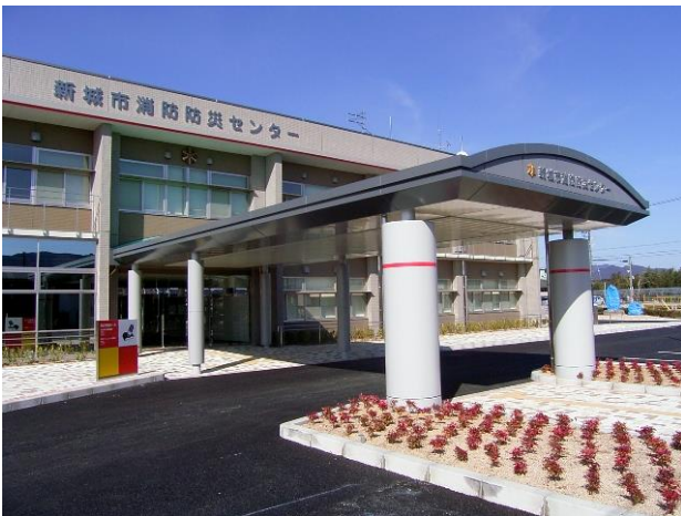
新城市消防防災センター（平井地内）

消防防災センターの1階に「防災学習ホール」が整備され、平成20年4月から一般市民向けにオープンしました。この防災学習ホールは、市民の皆さんが自分の住む地域、そして「我が家」が災害時にどのような状況に置かれるのかを学び、災害への備えを日常生活で実践するきっかけを提供しています。