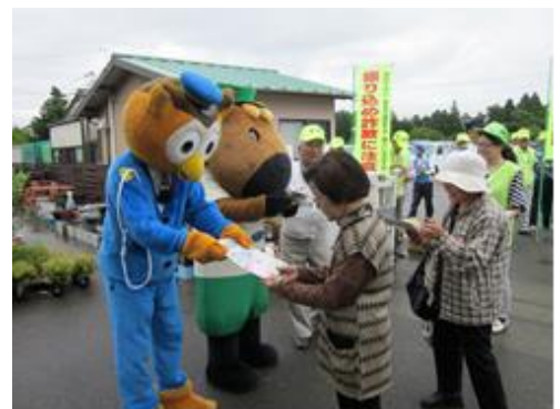
防犯キャンペーンの様子

このため、市ではその実現に向け、しんしろ安全・安心で快適なまちづくり条例に基づいて、市民・事業所・市等の行動主体ごとの取組事項・取組方向を示した、「しんしろ安全・安心で快適なまちづくり行動計画」を作成しました。この行動計画に沿って“市民総ぐるみのまちづくり運動”を展開していきます。