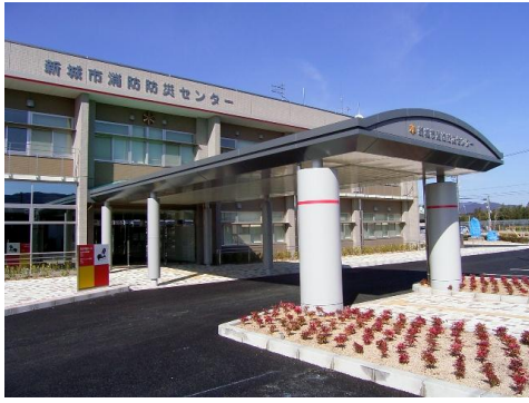
新城市消防防災センター（平井地内）