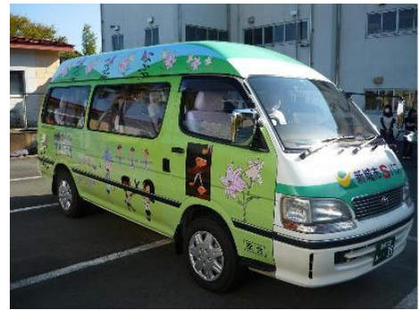
北部線ラッピングバス

平成21年度は、鳳来地区の塩瀬線に鳳来西小学校の児童全員の絵を、また平成22年度には新城地区の北部線にバス通学をしている東郷東小学校児童の絵をラッピングしました。鳥や魚、地域の歴史を描くなど乗ることが楽しくなるバスになりました。作手地区の守義線、つくであしがる線とあわせて4台のラッピングバスが市内を走っています。どのバスも地元みなさんに親しまれ、子どもたちの通学や高齢者の通院・買い物に活躍しています。