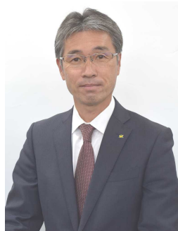
新城市長 下江 洋行

市職員の仕事は、すべて市民の幸せを願って行われます。その仕事で給与を受け取り、生活を支えます。ですから市民のため、地域のために骨を折ってみたいと思う人にとっては、うってつけの仕事です。