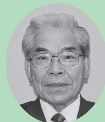
7番 やまぐちよういち 山口洋一

多くの皆様のご支援に、心より感謝申し上げます。新たな任期を迎え、再度選ばれた責任の重さを実感しています。議会も市政も「透明性とスピード感」をモットーに、これまでの4年間の任期における決定に責任を持ち、新東名が開通する新しい時代を見据え、市民の皆様と共に、自立した持続する地域づくりに向け、引き続き努力してまいります。