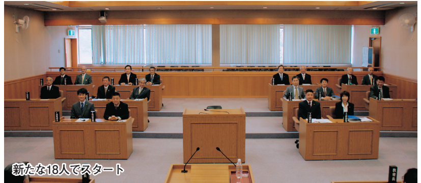
新たな18人でスタート