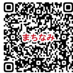
新城まちなみ情報センター ホームページ

※ 各施設の予約や利用方法、休館日、利用時間等は施設によって異なります。詳細については、利用希望施設へ直接お問合せいただくか、市ホームページで御確認ください。