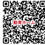
勤労青少年ホーム ホームページ

※ 施設を利用するにあたっては、利用規則・マナーを守るとともに、施設管理者の指示に従ってください。また、利用後は、机などを移動した場合は現状に戻し、ごみの持ち帰りに御協力をお願いします。