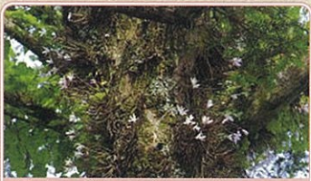
4 木に着生するセッコク