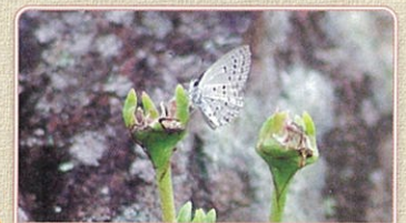
10 クロツバメシジミ