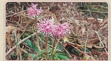
7 ショウジョウバカマ