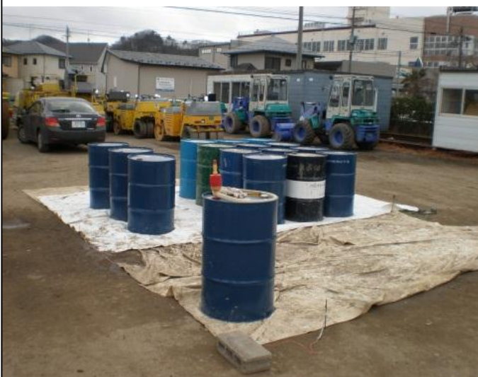
【ドラム缶による燃料の一時的な貯蔵例】

東日本大震災においては、給油取扱所等の危険物施設が大きな被害を受けたことや被災地への交通手段が寸断されたこと等により、ドラム缶から手動ポンプを用いての給油等、平常時とは異なる危険物の取扱いや、避難所等をはじめ危険物施設以外の場所で一時的に暖房用の燃料を貯蔵するなど、危険物の仮貯蔵・仮取扱いが数多く行われました。