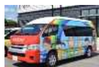
つくであしがる線