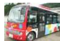
湯谷温泉 もっくる新城線