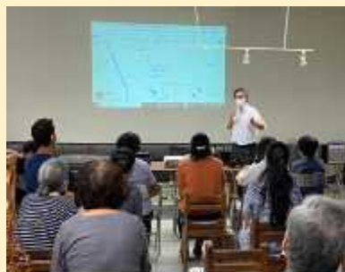
八名地区での検討会の様子

策定後に、モビリティマネジメントおよび各地域自治区における検討会、複数地域を跨いだ本市全体の意見交換など、地域が主体的に公共交通について検討できる体制づくりを行った。この継続した議論が現在、各地域の路線再編に向けた議論へと発展している。