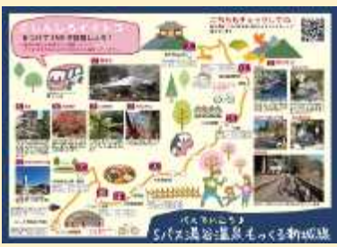
作成した観光マップ

市内の高校生・大学生からなる若者との協働で、マップ作成、車内掲示、車内音声案内の作成を行った。市内学生のバス活用への関心・意欲を高めるとともに、観光客への公共交通機関の利用案内を図るなど、多様な世代が意見を交えながら利用促進策を検討・実施することができた。