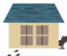
不審者(動物)の侵入