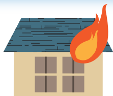
放火による火事・火災