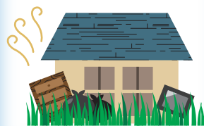
景観・衛生環境の悪化