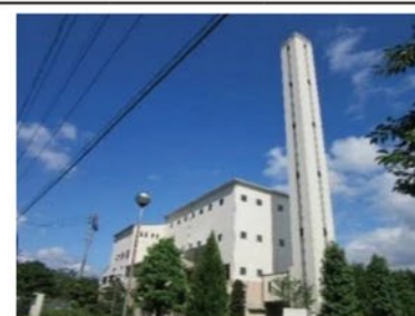
新城市クリーンセンター