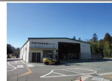
資源集積センター (クリーンセンターに隣接)