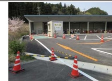
粗大ごみ受入場所 (クリーンセンターに隣接)