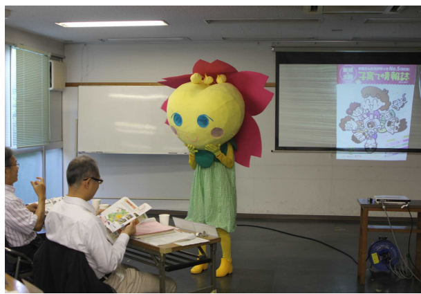
<審査会（公開プレゼンテーション）の様子>