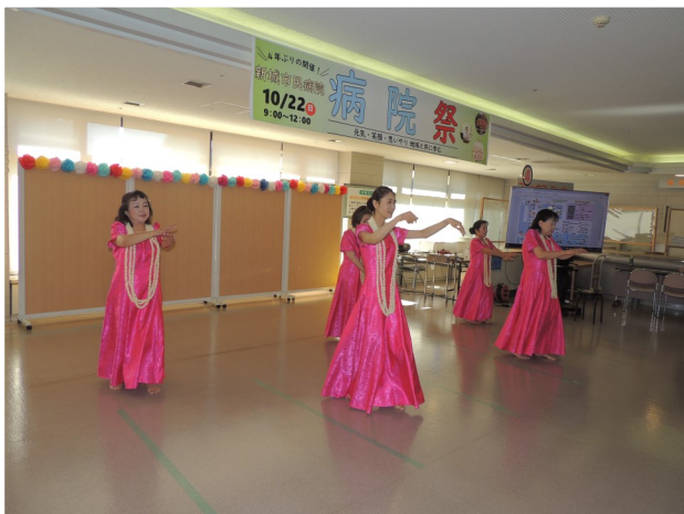
ステージイベント