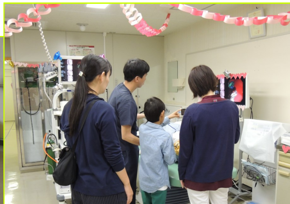
(内視鏡体験の様子)